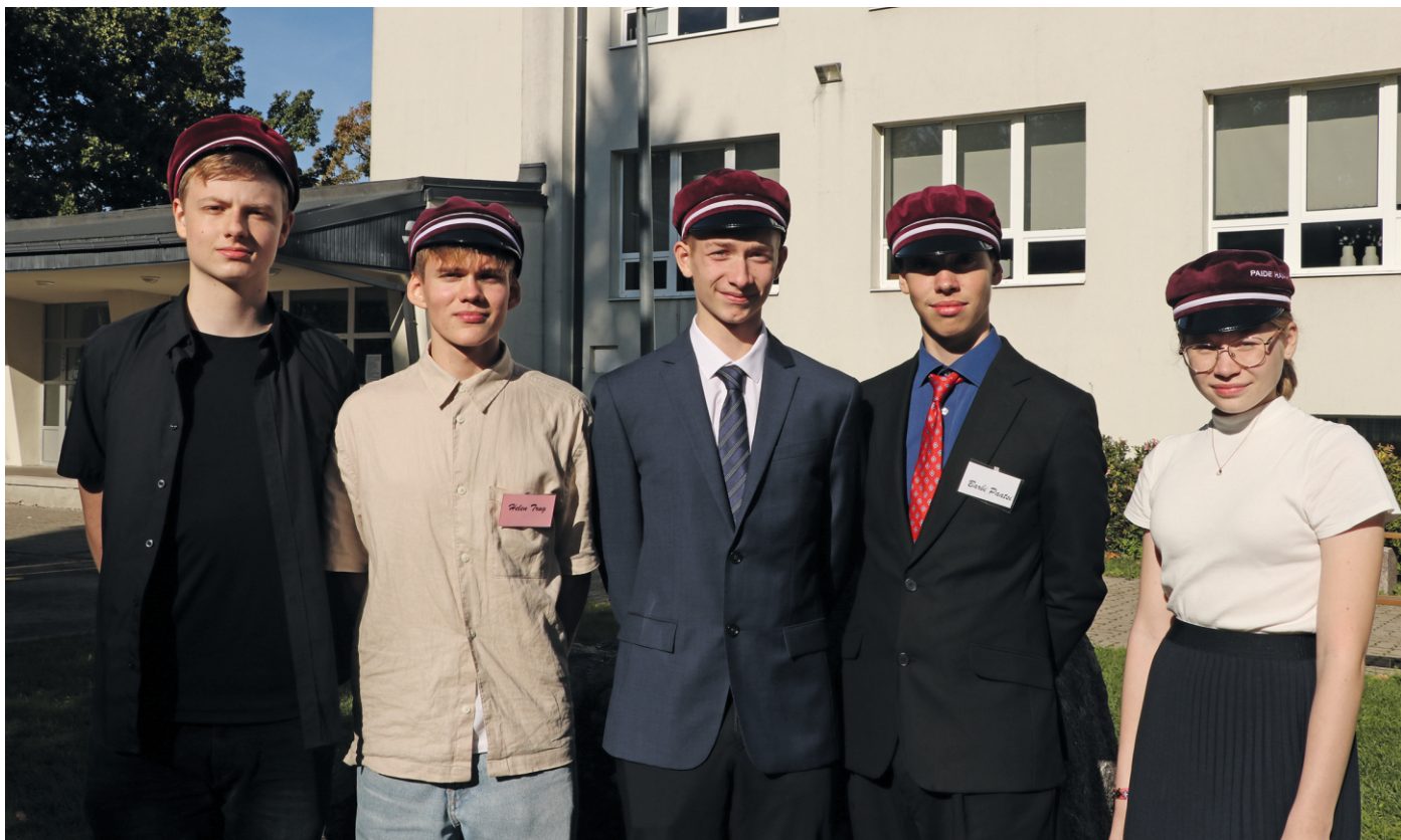
Õpilasesinduse juhatus 2023/24 õppeaastal